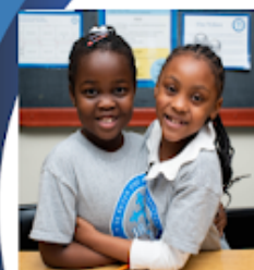
St. Peter the Apostle School PK 3 - Grade 8

215-922-5958 www.stpetertheapostleschool.com